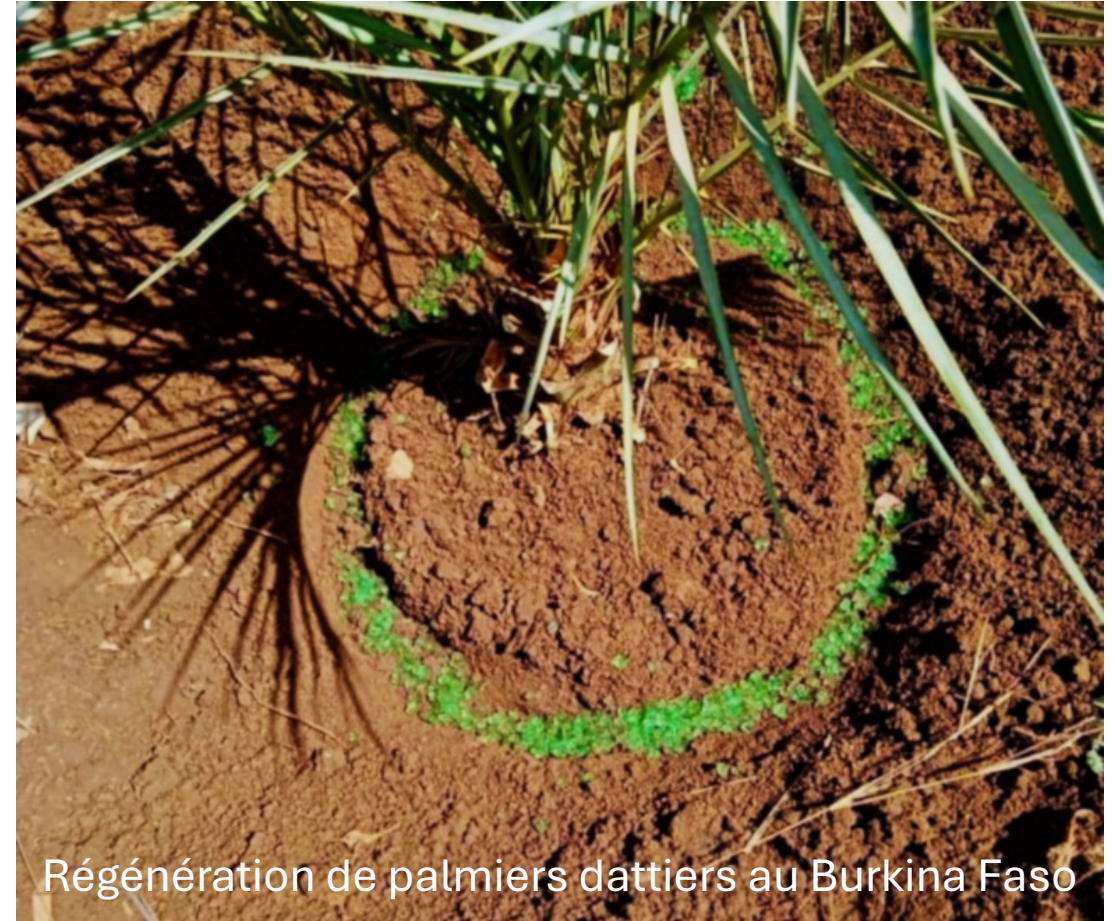
Régénération de palmiers dattiers au Burkina Faso

Cette approche vise à enrichir le sol autour des arbres fruitiers, facilitant ainsi la régénération des arbres affectés par des maladies.